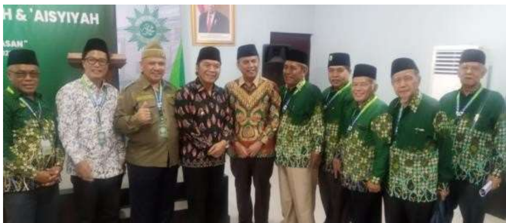
Gambar 1 Mukerwil Banten