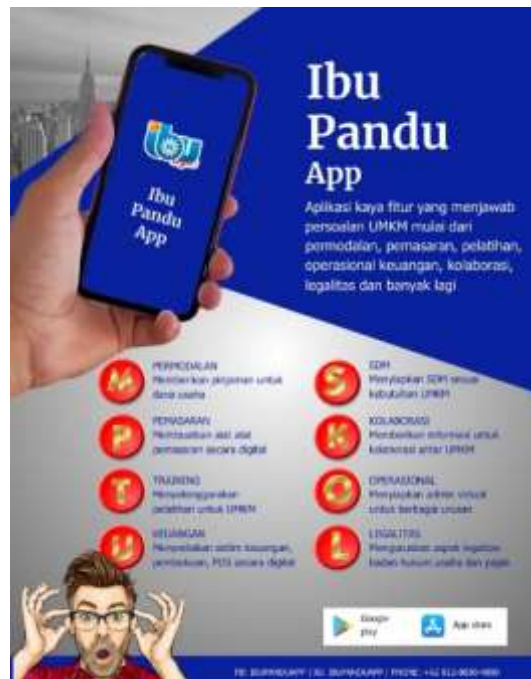
Gambar 2 Rancangan visi misi dan jasa layanan IBU pandu

Pada tahap persiapan melibatkan semua unsur yang ada di Fakultas Pariwisata dan Industri Kreatif (Dekanat, Ketua Jurusan, Ketua Program Studi, Dosen, Mahasiswa) agar semua memahami visi, misi, tujuan dan tugas fungsi dari keberadaan lembaga bentukan fakultas dalam bentuk Inkubator Bisnis dan Usaha (IBU) bidang Wisata dan Industri Kreatif. Kegiatan persiapan termasuk di dalamnya penyusunan visi misi serta perancangan jasa layanan Ibu pandu tertera dari Gambar 2.