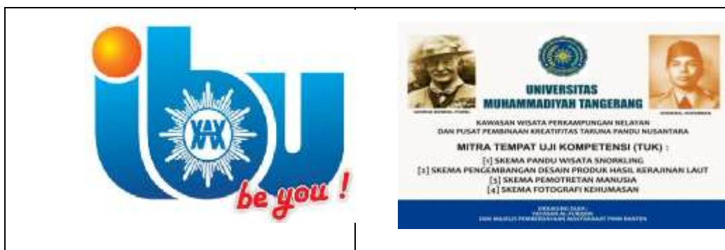
Gambar 4 Pendampingan di Tempat Uji Kompetensi (TUK) di Tangerang