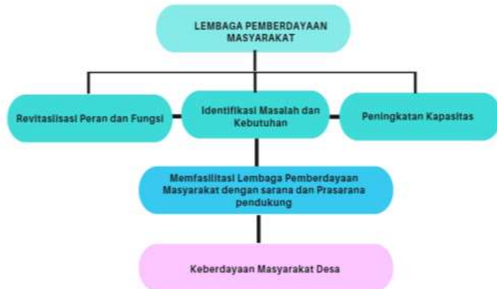
Gambar 3.. Keberdayaan Masyarakat Desa

Penguatan ekonomi Desa berdasarkan Gambar 1. Menunjukkan bahwa penguatan ekonomi desa didukung oleh 4(empat) faktor penguatan yang terdiri dari: 1).Penguatan kelembaggan, 2). Penguatan kapasitas, 3).Penguatan Pasar, 4).Keberlanjutan. Tahapan ini menuju peningkatan ekonomi keluarga yang lebih maju dan kreatif sehingga kesejahteraan tercapai.