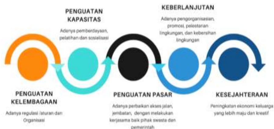
Gambar 2. Penguatan Ekonomi Desa